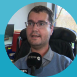
Gueric Deblire Autocars et Voyages Deblire